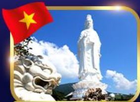
ชมพระอภิมหาอิม วัดหลินอึ้ง