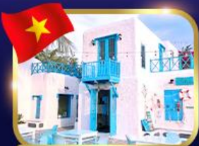
คาเฟ่สไตล์ซานโตรินี่ ชันตรา มาริน่า