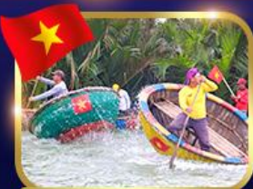
ล่องเรือกระดิว หมู่บ้านกัมบาน