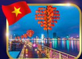
สะพานแห่งความรัก ดานัง