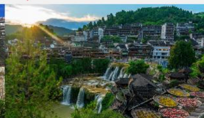
หมู่บ้านโบราณฝูหรงเจิ้น

*ทางบริษัทฯ ขอสงวนสิทธิ์ในการสลับโปรแกรมทัวร์ตามความเหมาะสมขึ้นอยู่กับสถานการณ์หน้างาน โดยคำนึงถึงผลประโยชน์ของลูกค้าเป็นสำคัญ