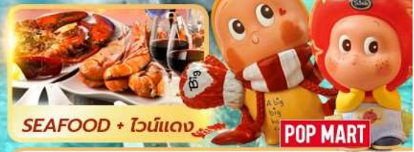
SEAFOOD + ไวน์แดง