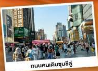
ถนนคนเดินชุนชิว