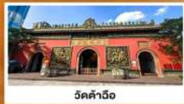
วัดต้าฉิว