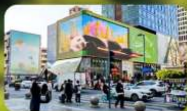
ไท่กุ่หลี่