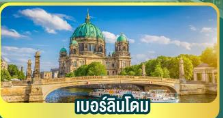
เบอร์ลินโดม