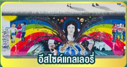
อีสไซด์แกลลอรี่