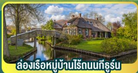
ล่องเรือหมู่บ้านไรน์บนทีรุรัน