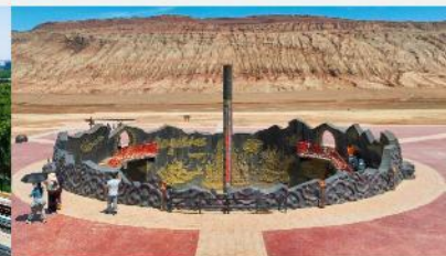
ภูเขาเปลวเพลิง

*ทางบริษัทฯ ขอสงวนสิทธิ์ในการสลับโปรแกรมทัวร์ตามความเหมาะสมขึ้นอยู่กับสถานการณ์หน้างาน โดยคำนึงถึงผลประโยชน์ของลูกค้าเป็นสำคัญ