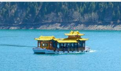
ล่องเรือทะเลสาบเกียนฉือ