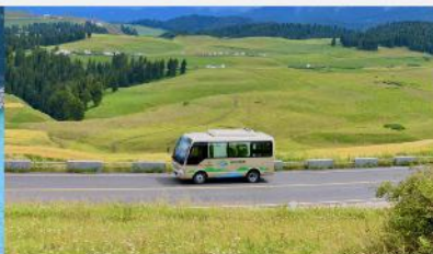
ทุ่งหญ้าเจียนปูลาเค่อ