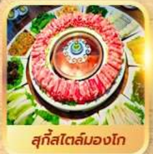
สุกีสโตลัมองโก