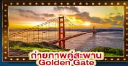
ถ่ายภาพคู่สะพาน Golden Gate