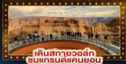
เดินสกายวอล์ก ชมแกรนด์แคนยอน