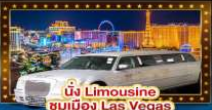
นั่ง Limousine ชมเมือง Las Vegas