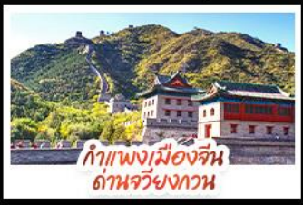
กำแพงเมืองจีน ด้านจวิ้นกวน

ส่องเรือสุดโรแมนติกแม่น้ำหวงผู้ ปักกิ่ง..เปิดประตูสู่แดนมังกร ด้วยความอลังการระดับจักรพรรดิ ชิงเต่า..เมืองชายทะเลสโตนโรสยุโรป หอหุราแบบพอนคลาย เซี่ยงไฮ้..มหานครแห่งเอเชีย เมืองที่ไม่เคยหลับใหล