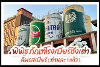
พิพิธภัณฑ์โรงเบียร์ชิงเต่า คิมรสเบียร์ (ท่าทะเล 1 แก้ว)