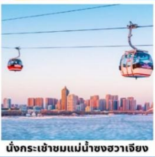
นั่งกระเช้าชมแม่น้ำขางจวเจียง