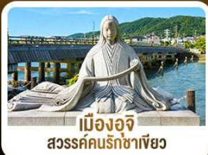
เมืองอูจิ สวรรค์คนรักชาเขียว