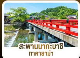
สะพานนากะบาชิ ทาคายามา