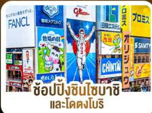
ช้อปปิ้งชินโซบาชิ และโดตงโบริ