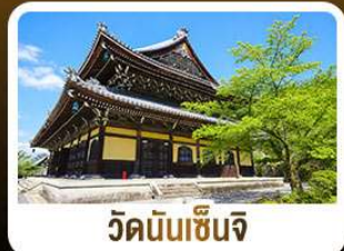
วัดนันเซ็นจิ