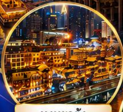
หงหยาดิ่ง