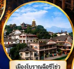
เมืองโบราณเฉิงชิว