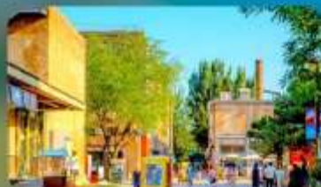
798 Art District