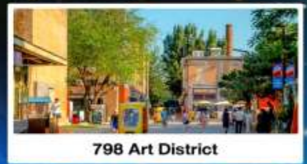
798 Art District