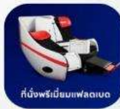
ที่นั่งพรีเมียมแฟลตเบด