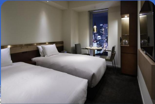
Japanese-style Room 19 sqm

ท่านสามารถเลือกช้อปปิ้งย่านดัง ช้อปปิ้งชินจูกุ ให้ท่านได้เพลิดเพลินกับการจับจ่ายซื้อสินค้านานาชนิด ได้จากที่นี่ ไม่ว่าจะเป็น ร้านชานริโอะ ร้านขายเครื่องอิเล็กทรอนิกส์ กล้องถ่ายรูปดิจิทัล นาฬิกา เครื่องสำอาง ต่างๆ กันที่ร้าน MATSUMOTO แหล่งรวมเหล่าบรรดาเครื่องสำอางมากมาย อาทิ มาร์คเต้าหู้, โฟมล้างหน้า WHIP FOAM ที่ราคาถูกกว่าบ้านเรา 3 เท่า, ครีมนกันแดดซีเซโต้ แอนเนสซ่าที่คนไทยรู้จักเป็นอย่างดี และสินค้าอื่น ๆ หรือให้ท่านได้สนุกกับการเลือกซื้อสินค้า แบรนด์ดัง อาทิ LOUIS VULTTON, UNIQLO, กระเป๋าสุดฮิต BAO BAO ISSEY MIYAKE, เสื้อ COMME DES GARCONS, H&M หรือเลือกซื้อรองเท้า หลากหลายแบรนด์ดัง อาทิ NIKE, CONVERSE, NEW BALANCE, REEBOK ฯลฯ ได้ที่ร้าน ABC MART