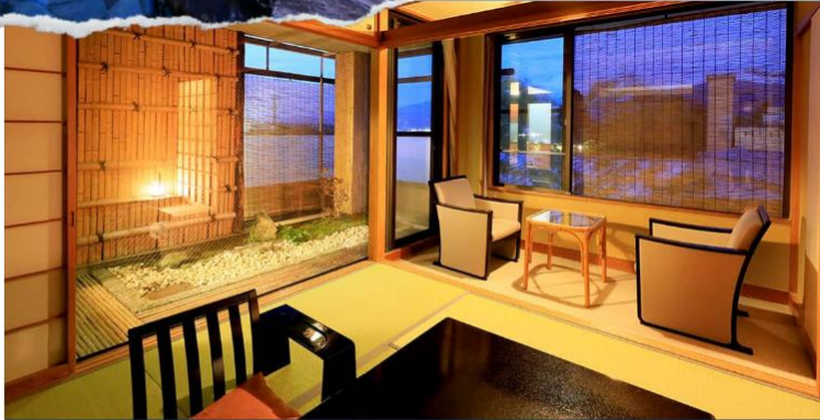
Japanese-style Room 17 sqm