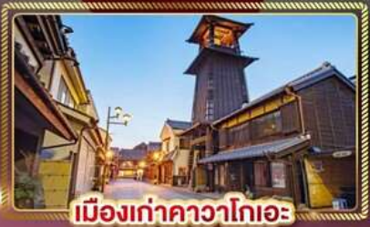
เมืองเก่าคาวาโกเอะ