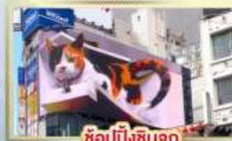
ซูปปิ้งชินจูกุ