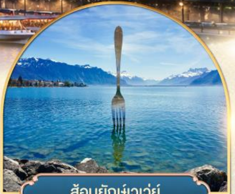
ส้อมยักเข่าเว่ย