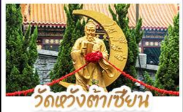
วัดเซว้งต้าเซียน