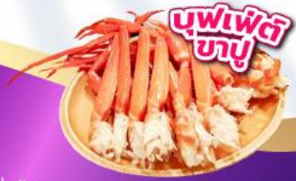
บุฟเฟ่ต์ ซาชิมิ