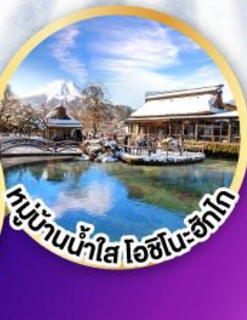
หมู่บ้านน้ำใส ไอชิโมะ-ซึโก