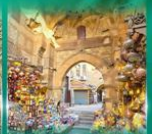
ตลาดผ่านเวลาลิลี่