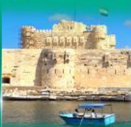
บึงนราการ Qulte Bay