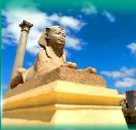
เสานินมืองเบย์