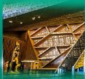
พิพิธภัณฑ์แกรนด์อียิปต์ (GEM)