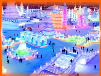
เที่ยว ICE & SNOW WORLD