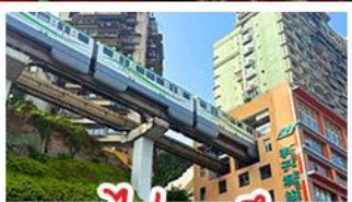
รถไฟทะลุคด