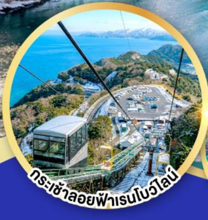
กระเช้าลอยฟ้าเรนโบว์ไลน์