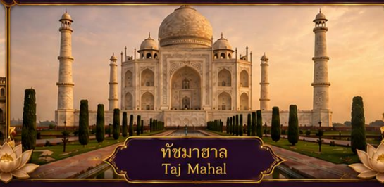
ทัชมาฮาล Taj Mahal