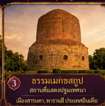
3 ธรรมเมกขสถูป สถานที่แสดงปฐมเทศนา เมืองสารนาถ, พาราณสี ประเทศอินเดีย