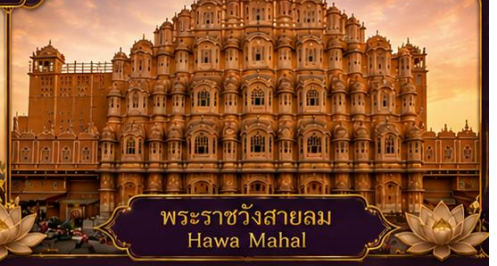
พระราชวังสายลม Hawa Mahal