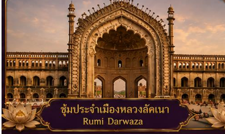
ซุ้มประจำเมืองหลวงลัคเนา Rumi Darwaza

พร้อมชมสิ่งมหัศจรรย์อินเดียในทริป 9 วัน 7 คืน