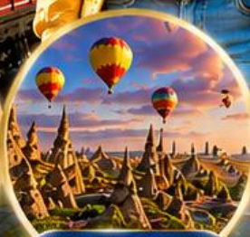
เมืองคัปปาโดเกีย Cappadocia