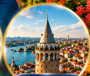
หอคอยกาลาตา Galata Tower