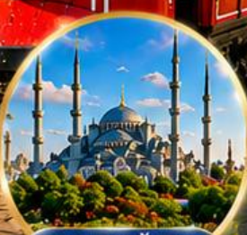
สุเหร่าสีน้ำเงิน Blue Mosque