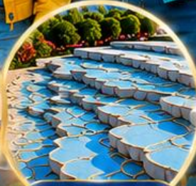
ปานุกคาล์ Pamukkale