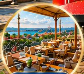
Seven Hills Cafe ชมวิว อิสตันบูล