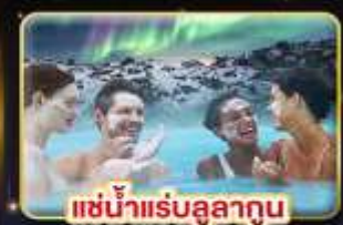
แช่น้ำแร่บลูลาگون