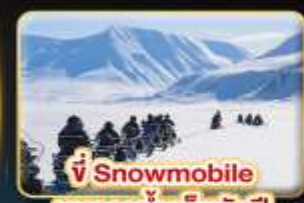
ขี่ Snowmobile บนธารน้ำแข็งพันปี