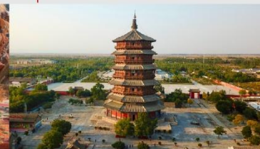
วัดเจดีย์ไม้ มู่ต้า

*ทางบริษัทฯ ขอสงวนสิทธิ์ในการสลับโปรแกรมทัวร์ตามความเหมาะสมขึ้นอยู่กับสถานการณ์หน้างาน โดยคำนึงถึงผลประโยชน์ของลูกค้าเป็นสำคัญ