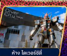
ห้าง ไดเวอร์ซิตี