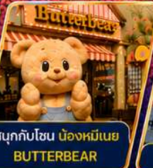
สนุกกับโซน นื่องหมีเนย BUTTERBEAR