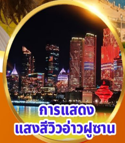
การแสดง แสงสีว้าว่าผู้ซาน