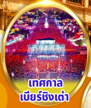
เทศกาล เบียร์ชิงเต่า