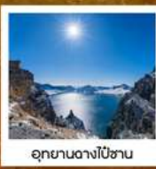
อุทยานดางไป่ชาน