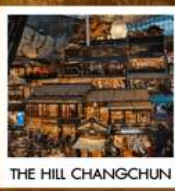
THE HILL CHANGCHUN