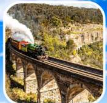
ZIG ZAG RAILWAY