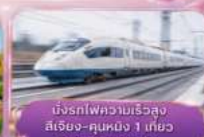
นั่งรถไฟความเร็วสูง สี่เจียง-คุนหมิง 1 เที่ยว (รวมรถชนกระบี่)