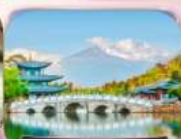
ละมิงกรต้า