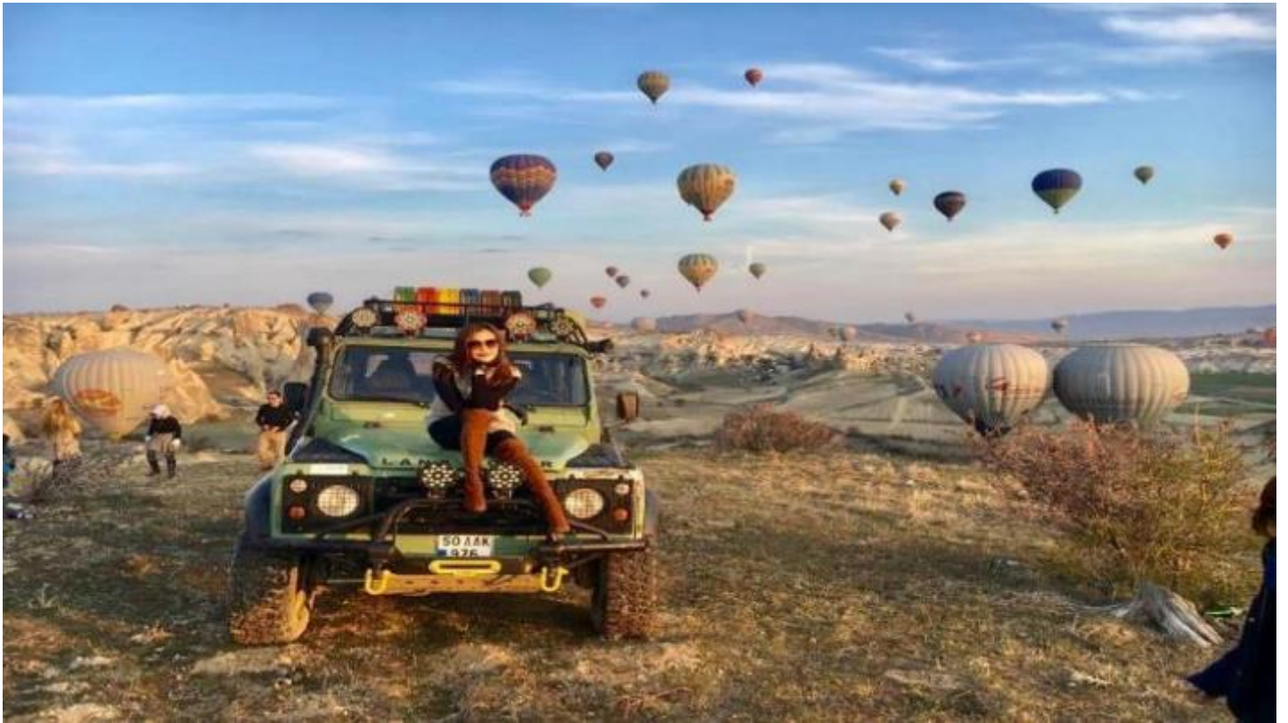
3. Classic Car นั่งรถคลาสสิก เปิดประทุน สูดอากาศ เย็น สดชื่น พร้อมชมบอลลูนสีสดใส วิวเมือง คัปปาโดเกีย ค่าใช้จ่าย 120 USD / ท่าน