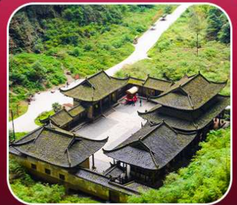
"อุทยานหลุมฟ้า"

T2G-CKG34(3U) The Best Chongqing...ฉงชิ่ง ต้าจู้ อุ่หลง เขานางฟ้า 5D 4N (3U)