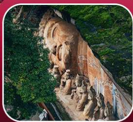
"ผาหินแกะสลักต้าจู้"