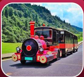
"อุทยานเขานางฟ้า"