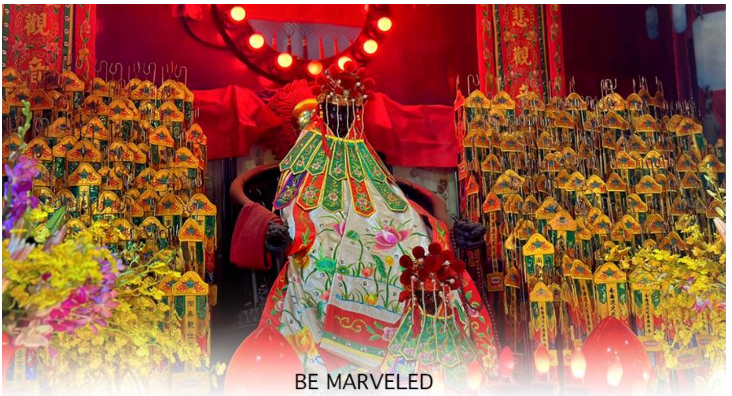
BE MARVELED วัดเจ้าแม่กวนอิมฮวงอ้า (ยิมฮิน)

ให้เดินทางกลับไปกราบไหว้ และขอบคุณเจ้าแม่กวนอิมอีกครั้ง โดยเตรียมชุดไหว้และกระดาษาเงินกระดาษาทองที่เป็นเหมือนเงินที่เรานำมาคืน เป็นการไหว้เพื่อคืนเงินเจ้าแม่กวนอิมนั่นเอง