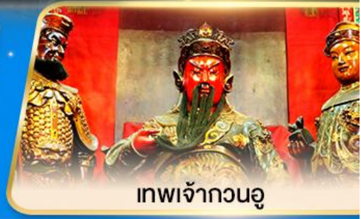
เทพเจ้ากวนอู