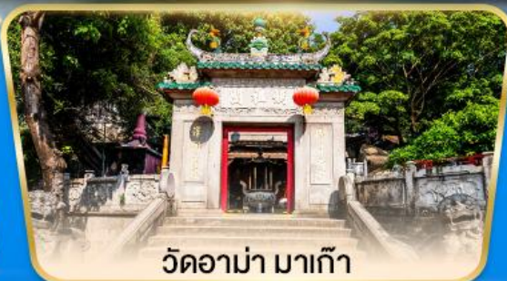
วัดอามา มาเก๊า