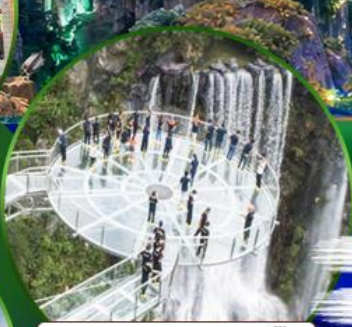
สะพานแก้วคู่หลงเซี่ยะ