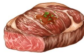
● ไม่ทานเนื้อหมู