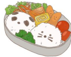
● อาหารสำหรับเด็ก ( 2-11 ปี ) *วัตถุดิบขึ้นอยู่กับทาว์ราน