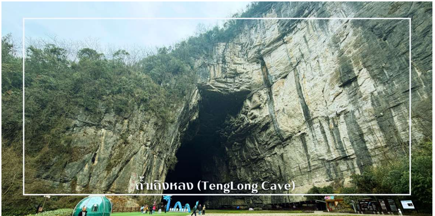
ถ้ำเถิงหลง (TengLong Cave)

นำท่านสู่ ถ้ำเถิงหลง (TengLong Cave) สถานที่ท่องเที่ยวระดับ 5A หนึ่งในถ้ำหินปูนที่ใหญ่และงดงามที่สุดของจีน ได้รับการขนานนามว่าเป็น ราชาแห่งถ้ำคาสต์ ด้วยความอลังการของธรรมชาติที่ก่อกำเนิดมากกว่า 300 ล้านปี ตัวถ้ำมีความยาวมากกว่า 50 กิโลเมตร แบ่งออกเป็นถ้ำแห้งและถ้ำเปียก ภายในเต็มไปด้วยหินงอกหินย้อยรูปร่างแปลกตา โถงถ้ำสูงใหญ่โอ่อ่า มีลำธารใสไหลผ่านกลางถ้ำ ตลอดเส้นทางยังมีการจัดแสงสีตระการตา เพิ่มบรรยากาศเสมือนเดินทางอยู่ในดินแดนแฟนตาซี