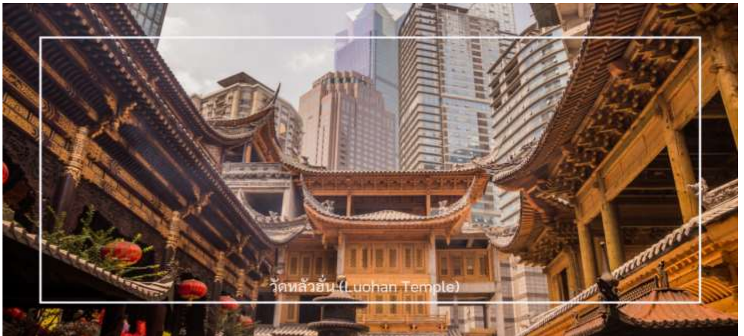
วัดหลัวฮั่น (Luohan Temple)

นำท่านเที่ยวชม วัดหลัวฮั่น (Luohan Temple) หรือที่เรียกว่า "วัดอรหันต์" เป็นวัดที่มีชื่อเสียงในเมืองฉงชิ่ง มีประวัติศาสตร์ยาวนานและมีความสำคัญในด้านศาสนาพุทธ วัดหลัวฮั่นมีพระพุทธรูปและรูปปั้นอรหันต์จำนวนมาก ซึ่งเป็นที่เคารพนับถือของผู้มาเยือน นอกจากนี้ยังมีบริเวณที่ให้ผู้เข้าชมสามารถทำบุญและสวดมนต์