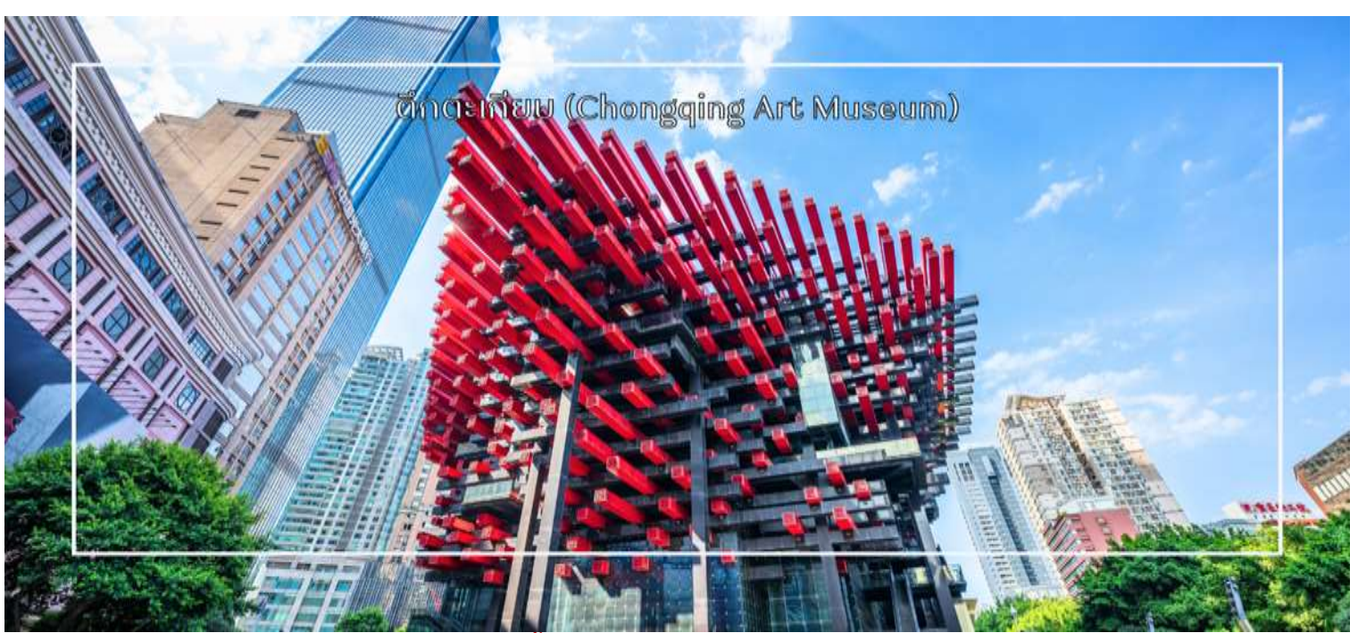
ตึกแกลเลียม (Chongqing Art Museum)