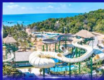
สวนสนุก Sun world Hon thom