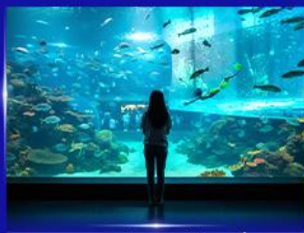
อควาเรียมยักษ์รูปเต่า