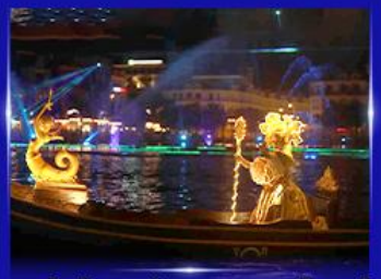
ชมโชว์เวนิสจำลอง แกรนด์วิลด์