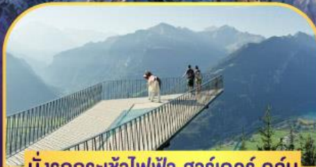
นั่งรถกระเช้าไฟฟ้า ชาร์เตอร์ คูล์ม