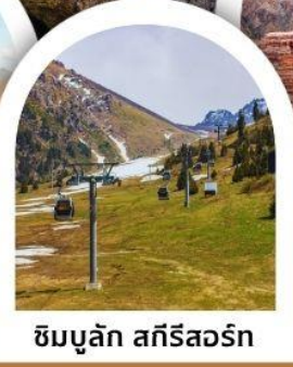
ซิมบูลัก สกีรีสอร์ท