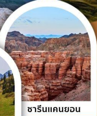
ซารินแคนยอน