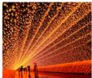
นาบานะ โนะ ซาโตะ