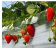
สวนสตรอว์เบอร์รี่