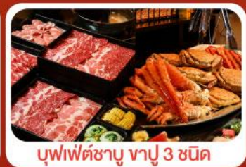
บุฟเฟ่ต์ซาบู ซาปู 3 ชนิด