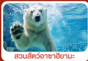
สวนสัตว์อาซาฮิยามะ