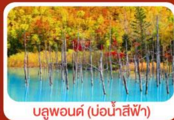
บลูพอนด์ (บ่อน้ำสีฟ้า)