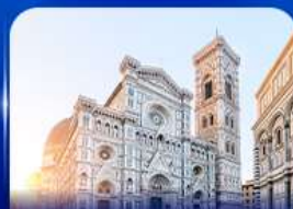
ชมเมืองแห่งศิลปะ ฟลอเรนซ์