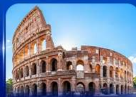
เชิควินดัง โคลอสเซียม โรม