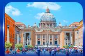
นครรัฐวาติกัน โรม