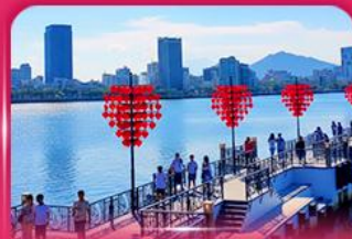
สะพานแห่งความรัก