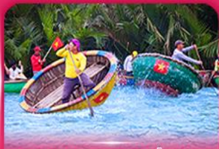
ส่องเรือกระดัง หมู่บ้านกิมทาน