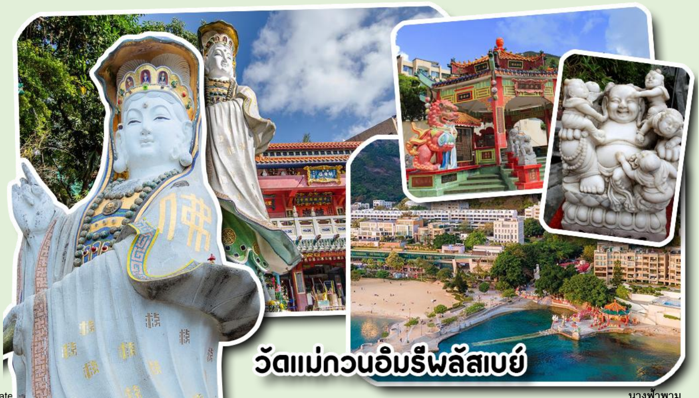
วัดแม่กวนอิมริพลัสเบย์

จากนั้นพาท่านเดินทางไปนมัสการ เจ้าแม่กวนอิมริมหาดริพลัสเบย์ วัดแห่งนี้ถูกสร้างขึ้นเพื่อคุ้มครองชาวประมงเวลาออกเรือไปหาปลาในสมัยก่อน บริเวณวัดมีสิ่งศักดิ์สิทธิ์มากมาย ได้แก่ เจ้าแม่กวนอิม ประดิษฐานอยู่ทางด้านซ้ายของวัด ซึ่งผู้คนนิยมเดินทางไปกราบไหว้ขอพรเรื่องการมีบุตร และยังมีพระสังกัจจายที่เชื่อกันว่าสามารถขอเพศของบุตรที่จะมาเกิดได้ โดยหลังจากกราบไหว้แล้วก็ให้ลูบที่ท้องของพระสังกัจจาย ถ้าอยากได้ลูกชายให้ลูบท้องซ้าย อยากได้ลูกสาวให้ลูบท้องขวา ถัดมาคือ เจ้าแม่ทับทิมเทพีแห่งท้องทะเล ท่านจะคอยคุ้มครองผู้เดินทางทางเรือ หรือผู้ที่เดินทางไปไหนมาไหนท่านจะคอยคุ้มครองให้ปลอดภัย และมีโชคลาก ถัดจากบริเวณที่กราบไหว้ขอพร ก็จะมีศาลาแปดเหลี่ยมริมน้ำ และสะพานเล็กๆ ที่ชื่อว่าสะพานต่ออายุ ซึ่งเชื่อกันว่าหากเดินข้ามสะพานแห่งนี้ 1 ครั้ง ก็จะมีอายุยืนขึ้น 3 ปี