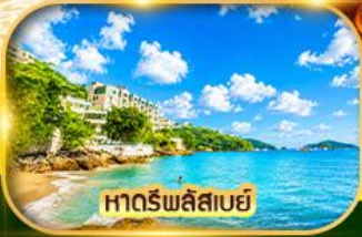
หาดริฟลีสบาย