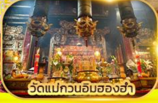
วัดแม่กวนอิมสองอ่า