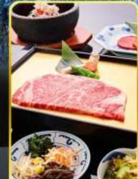
ปิ้งย่าง ROKKASEN

ออนเซ็น 3 คั้น มน.กระเป๋า 1 ใบ 23 กก 9Days 6Night