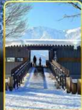
ฮาคุบะอิวาตาคะ