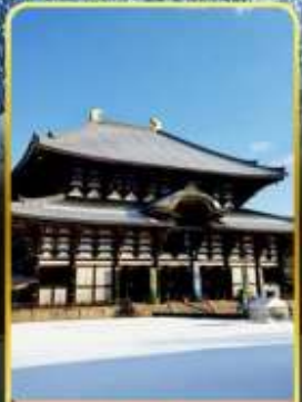
นาราโกไดจิ

พิเศษพักในเมืองคุสัทสึออนเซ็นพร้อมชมยูบาคาเกะ