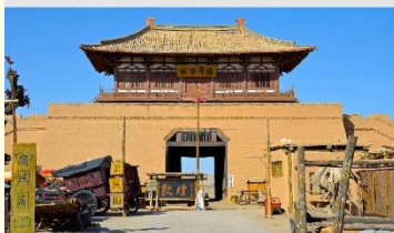
เมืองโบราณตุนหวง