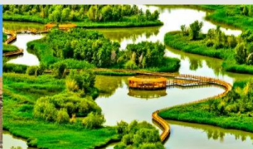
อุทยานพื้นที่ชุ่มน้ำจางเย่