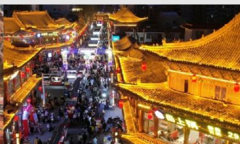
ตลาดกลางคืนจางเย่

*ทางบริษัทฯ ขอสงวนสิทธิ์ในการสลับโปรแกรมทัวร์ตามความเหมาะสมขึ้นอยู่กับสถานการณ์หน้างาน โดยคำนึงถึงผลประโยชน์ของลูกค้าเป็นสำคัญ