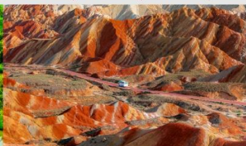
ภูเขาสายรุ้งจางเย่ต้นเสี่ย