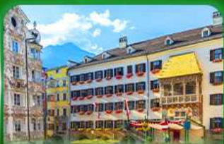
หลังคาทองคำ ซาล์ซบูร์ก