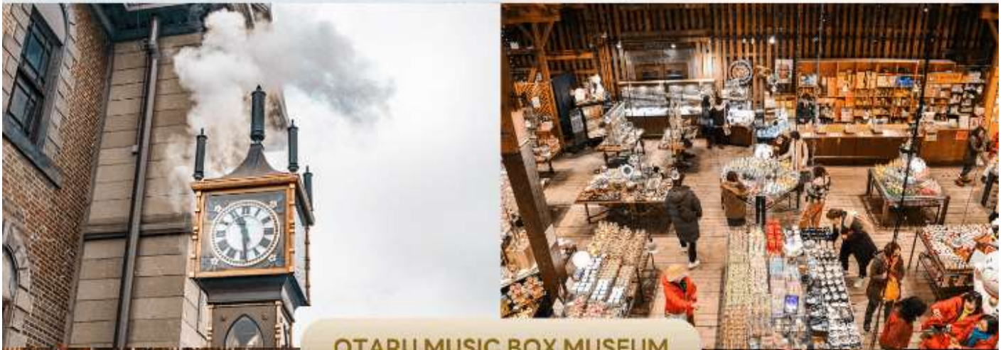
OTARU MUSIC BOX MUSEUM